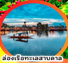
ล่องเรือทะเลสาบตาเล