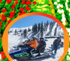
ขี่ SNOW MOBILE