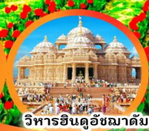
วิหารอินดูชฆาตัม