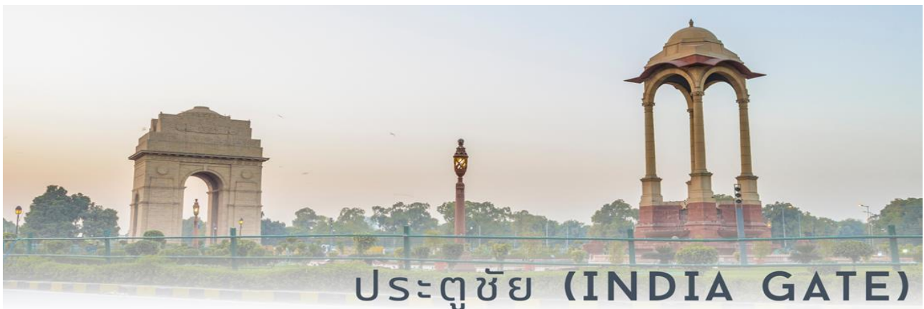
ประตูชัย (INDIA GATE)

จากนั้น ขึ้นรถผ่านชม ประตูชัย (India Gate) เป็นอนุสรณ์สถานของเหล่าทหารหาญที่เสียชีวิตจากการร่วมรบกับอังกฤษในสมัยสงครามโลก ครั้งที่ 1 และสงครามอัฟกานิสถาน ประตูชัยแห่งนี้จึงถือได้ว่าเป็นสัญลักษณ์แห่งหนึ่งของกรุงนิวเดลี โดยซุ้มประตูแห่งนี้มีสถาปัตยกรรมคล้ายประตูชัยของกรุงปารีสและนครเวียงจันทน์ ซึ่งมีความสูง 42 เมตร สร้างขึ้นจากหินทรายเมื่อปีคริสต์ศักราชที่ 1931 บนพื้นผิวของประตูชัยแห่งนี้จะปรากฏรายนามของทหารที่เสียชีวิตถูกแกะสลักไว้ และบริเวณใต้โค้งประตูจะปรากฏคบเพลิงที่ไฟไม่เคยมอดดับเพื่อเป็นการรำลึกถึงผู้เสียชีวิตในสงครามอินเดีย-ปากีสถาน เมื่อปีคริสต์ศักราชที่ 1971 มีทหารยามเฝ้าบริเวณประตูชัยตลอดเวลาเพื่อป้องกันการก่อวินาศกรรม