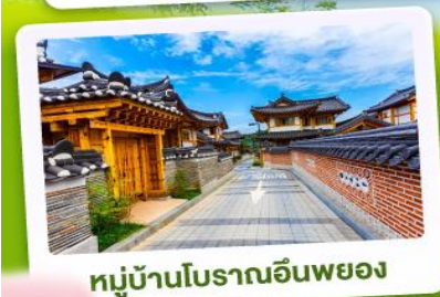
หมู่บ้านโบราณอินพยอง