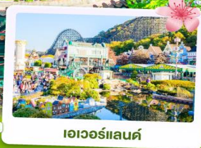
เอเวอร์แลนด์

ชม หอคอยเอ็นโซลทาวเวอร์ สัญลักษณ์กรุงโซล