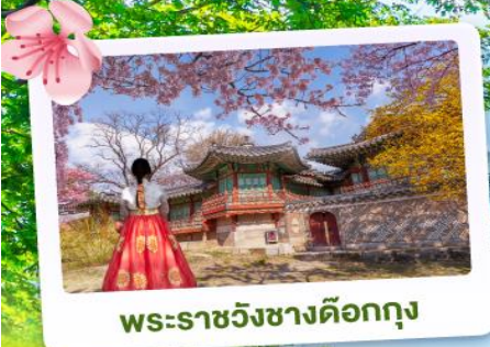
พระราชวังชางด็อกกุง