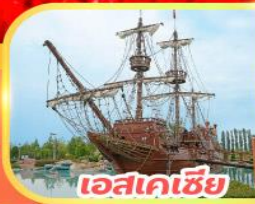
เอสเคเซีย