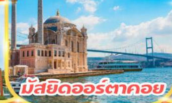
มัสยิดออร์ตาคอย