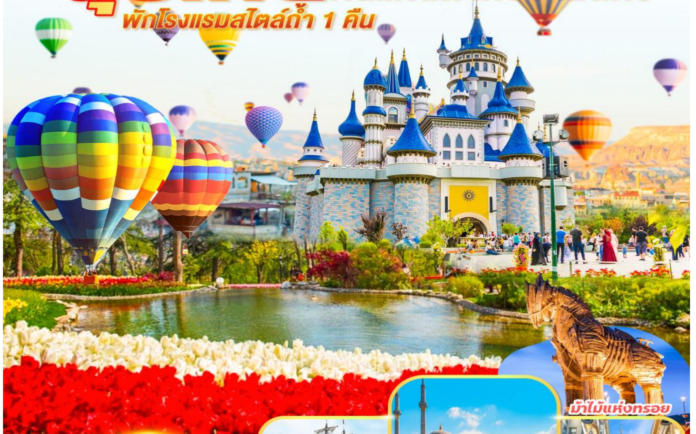
ม้าไม้แห่งทรอย