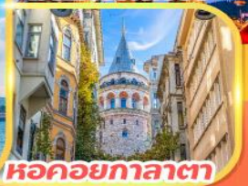
หอคอยกาลาตา