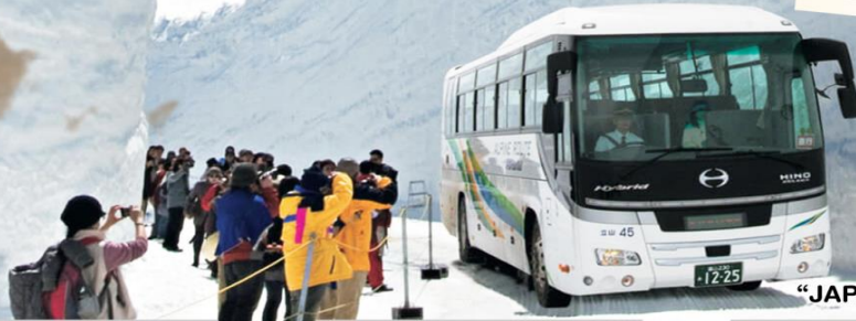
"JAPAN ALPINE ROUTE"