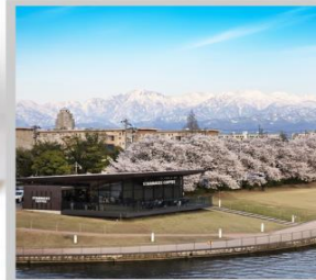
"TOYAMA KANSUI PARK"