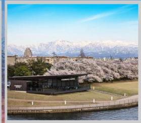
“TOYAMA KANSUI PARK”