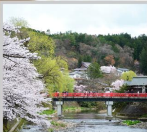
"TAKAYAMA OLD TOWN"