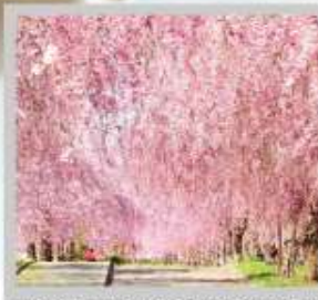
"NICCHUSEN WEEPING SAKURA"