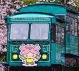
"FUNAOKA JOSHI + HITOME SENBONZAKURA"