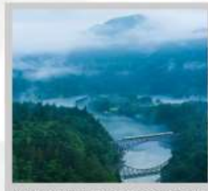
"TADAMI FIRST BRIDGE"

เปลี่ยนอริยาบทสู่การเปิดประสบการณ์ "นั่งรถไฟชินคันเซน (SHINKANSEN)" รถไฟที่วิ่งเร็วที่สุดในญี่ปุ่น ชม "สวนนิกชูเซน ซากุระสายพันธุ์จิคาระ" ที่ซากุระมีลักษณะโดดเด่นกิ่งที่โน้มต่ำมากกว่า 1,000 ต้น เดินเล่น "หมู่บ้านกินซันออนเซ็น" หมู่บ้านออนเซ็นเล็กๆ ที่มีเรียวกังเรียงรายเลียบบแม่น้ำ และมีชื่อเสียงมายาวนาน ส่องเรือชมความงาม "หุบเขาเกบิเค" เรือไม้ขนาดใหญ่ไม่มีหลังคาสามารถชมวิวตลอด 2 ฝั่งน้ำได้อย่างตื่นตาตื่นใจ ชมความงามของ "ทุ่งฟิงค์มอส สวนชิบะซากุระเมืองอิจิโตะ" มนต์เสน่ห์..พรมธรรมชาติสีชมพูหลากสีสินสวยสดใส ตระการตาดอกซากุระ ณ "สวนฟูนาโอกะ โจชิ" เป็นเขาสูงซึ่งเต็มไปด้วยต้นซากุระกว่า 1,000 ต้น ตามแนวแม่น้ำชิโรอิชิ