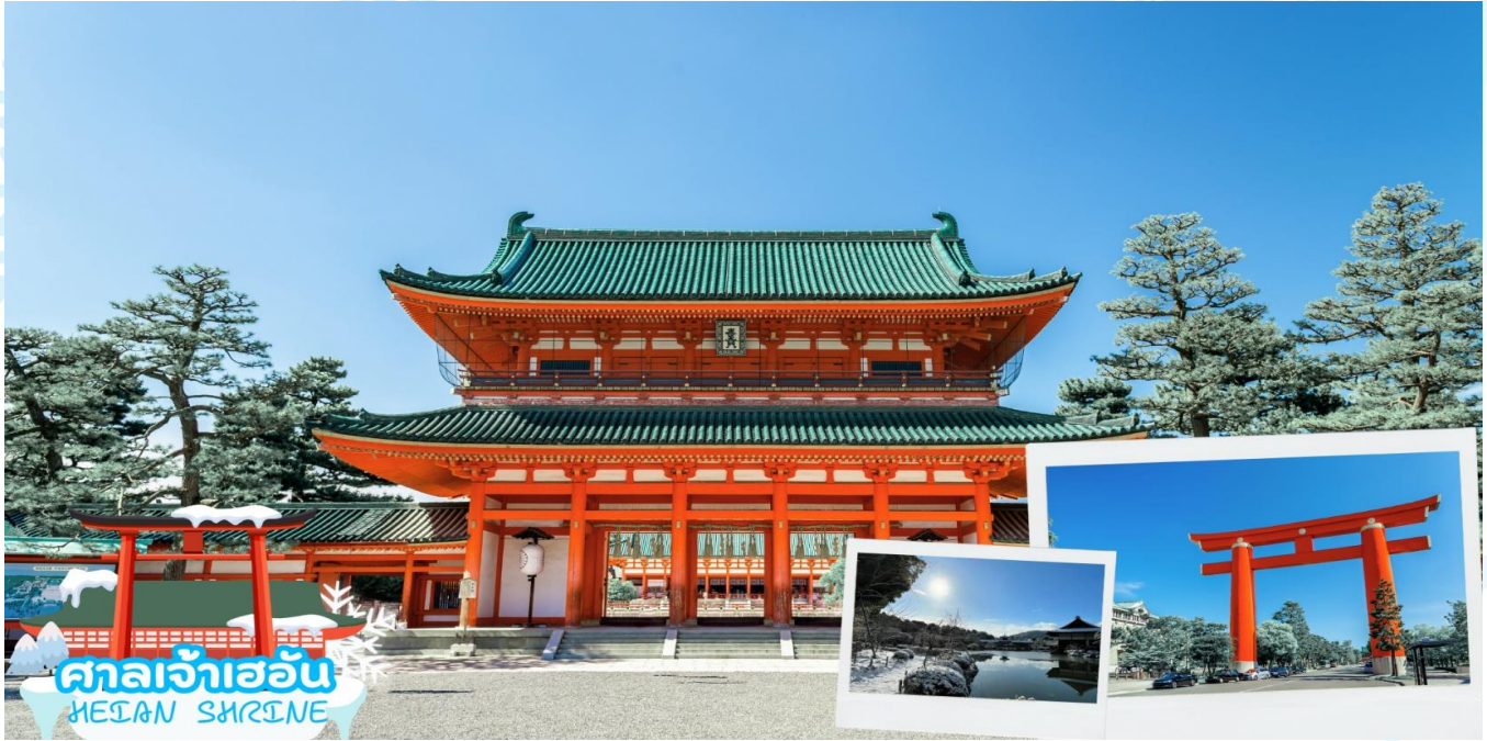
ศาลเจ้าเฮอัน HEIAN SHRINE

สัมผัสวัฒนธรรมดั้งเดิมของชาวญี่ปุ่น ให้ท่านได้ร่วม กิจกรรมชงชาญี่ปุ่น (Sado) โดยการชงชาตามแบบญี่ปุ่นนั้น มีขั้นตอนมากมาย เริ่มตั้งแต่การ ชงชา การจับถ้วยชา และการดื่มชา ทุกขั้นตอนนั้นล้วนมีขั้นตอนที่มีรายละเอียดที่ประณีตและสวยงามเป็นอย่างมาก และท่านยังมีโอกาสได้ลองชงชาด้วยตัวท่านเองอีกด้วย ซึ่งก่อนกลับให้ท่านอิสระเลือกซื้อของที่ฝากของที่ระลึกตามอัธยาศัย