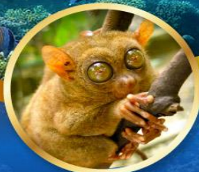
ลิงการ์เซีย