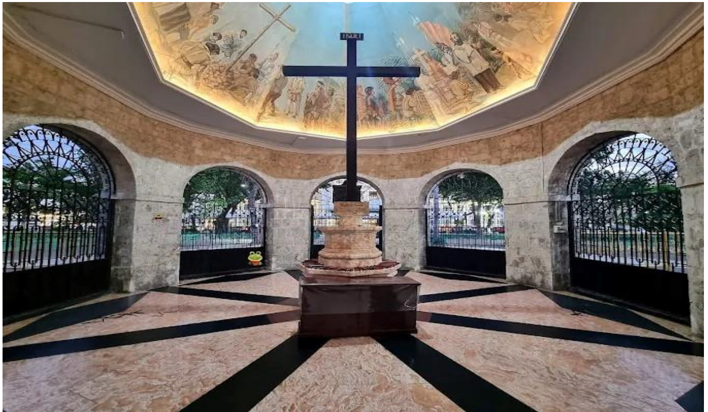
GO1CEB-5J102 CEBU Mabuhay Sea. Sand. Smile. ดำน้ำชมฉลามวาฬ เกาะโบโฮล 4วัน2คืน โดยสายการบิน Cebu Pacific (5J)