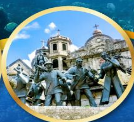
อนุสาวรีย์มรดกแห่งเซบู