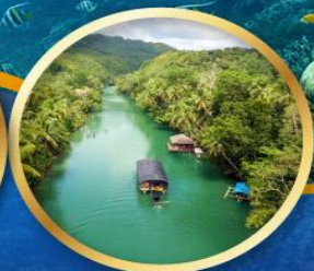
ล่องเรือแม่น้ำโลบ็อก