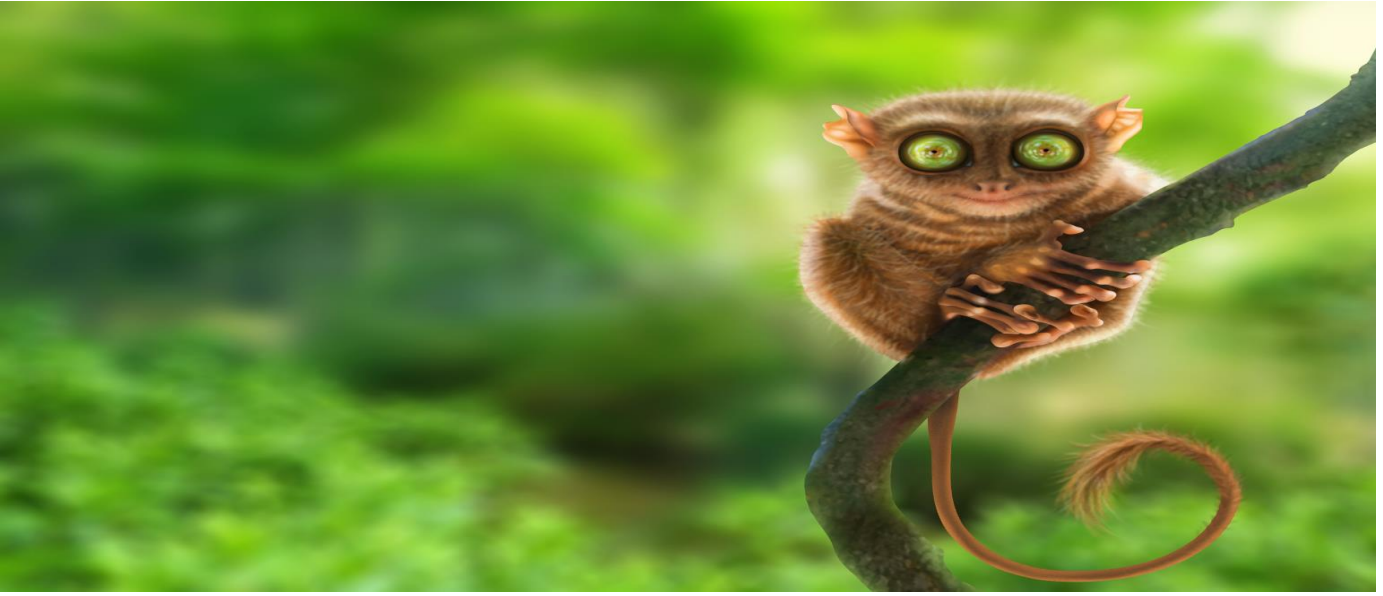
GO1CEB-5J102 CEBU Mabuhay Sea. Sand. Smile. ดำน้ำชมฉลามวาฬ เกาะโบโฮล 4วัน2คืน โดยสายการบิน Cebu Pacific (5J)

จากนั้นพาท่านชม ช็อกโกแลตฮิลล์ (Chocolate Hills) เป็นสถานที่ท่องเที่ยวที่มีชื่อเสียงของโบโฮล เนินเขาที่มีรูปทรงและสี คล้ายคลึงกับช็อกโกแลต แล้วยิ่งถ้าหากทุกคนมองเห็นเขาทั้งหมดนี้จากมุมสูง ภาพที่เห็นจะมีลักษณะเหมือน ช็อกโกแลต ที่เรียงรายต่อกัน ไปจนสุดลูกหูลูกตา ครอบคลุมพื้นที่ไปมากกว่า 50 ตารางกิโลเมตร และคาดว่ามีความสูงอยู่ระหว่าง 1,260 ถึง 1,776 ลูก โดยความสูงเฉลี่ยของเนินเขาเหล่านี้จะอยู่ที่ 30 - 50 เมตร ซึ่งลูกที่ใหญ่ที่สุดจะมีความสูงมากถึง 120 เมตร กันเลยทีเดียว