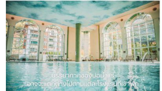
บรรยากาศของบ่อน้ำแร่ อาจจะแตกต่างกันไปตามแต่ละโรงแรมที่พัก