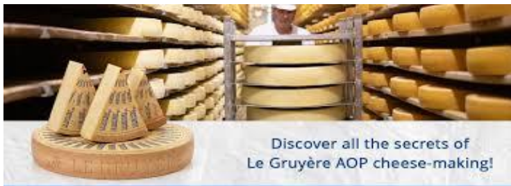
Discover all the secrets of Le Gruyère AOP cheese-making!

🕒 บริการอาหารกลางวัน ณ ภัตตาคาร หลังจากนั้น นำท่านเข้าชม โรงงานชีสกรูแยร์ชื่อดังของสวิตเซอร์แลนด์ (La Maison du Gruyère Cheese Factory) ใช้เวลาเดินทางประมาณ 1 ชั่วโมง ซึ่งเป็นหนึ่งในชีสที่มีชื่อเสียงที่สุดของประเทศสวิตเซอร์แลนด์ ตั้งอยู่ท่ามกลางบรรยากาศชนบทแสนสวยของเมืองกรูแยร์ ระหว่างการเข้าชมท่านจะได้เรียนรู้ขั้นตอนการผลิตชีสกรูแยร์ตั้งแต่การคัดเลือกน้ำนมสด การทำชีสแบบดั้งเดิม ไปจนถึงการบ่มชีสในห้องเก็บเฉพาะ ผ่านนิทรรศการและสื่อมัลติมีเดียที่เข้าใจง่าย และสามารถเลือกซื้อชีสกรูแยร์หลากหลายอายุ รวมถึงผลิตภัณฑ์ท้องถิ่นของสวิตเซอร์แลนด์เป็นของฝากตามอัธยาศัย ได้เวลาอันสมควรนำท่านสู่สนามบินเมืองซูริค