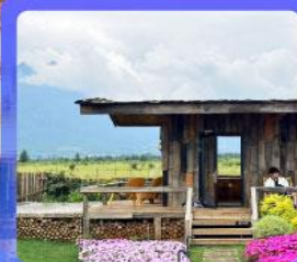
ร้านกาแฟหยุนตี้อัน