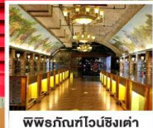
พิพิธภัณฑ์ไวน์ชิงเต่า