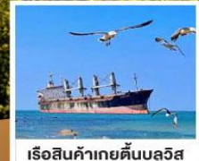
เรือสินค้าเกย์ตันบลูวิส