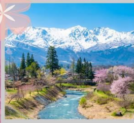
"HAKUBA OIDE PARK"