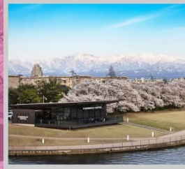
"TOYAMA KANSUI PARK"