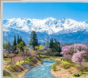
“HAKUBA OIDE PARK”