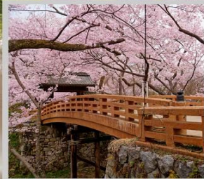
“TAKATO CASTLE RUINS”