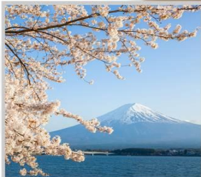
“LAKE KAWAGUCHIKO SAKURA”