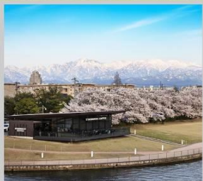
“TOYAMA KANSUI PARK”