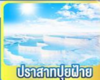
ปราสาทฟูฟาย