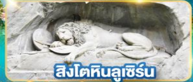
สิงโตหินลูเซิร์น