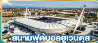
สนามฟุตบอลยูเวนตุส