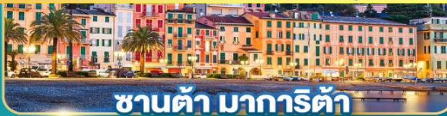
ซานต้า มารีต้า

08-14, 10-16, 17-23 มี.ค. 69 / 21-27, 23-29 เม.ย. 69 04-10, 05-11 พ.ค. 69 / 27 พ.ค. - 02 มี.ย. 69