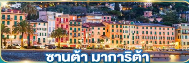
ซานต้า มารีต้า

พิเศษ! ขึ้นกระเช้า 360 องศา พิชิตยอดเขาทีทลิส