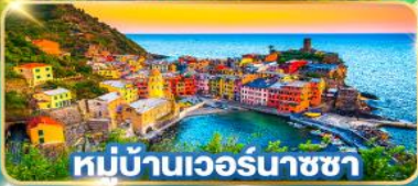
หมู่บ้านเวอร์นาซซา