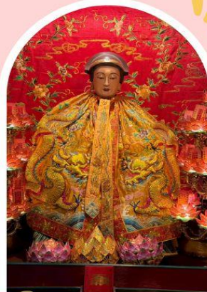
วัดหล่งโหมว

ความสำเร็จ ความมั่งคั่ง เงินทองไหลมาเทมา