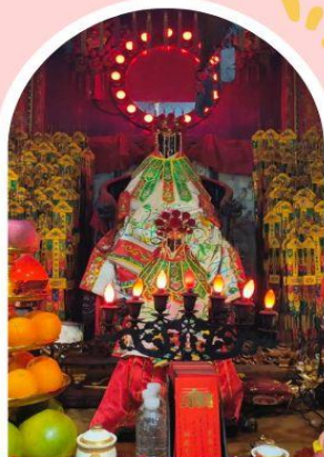
วัดเจ้าแม่กวนอิมฮ่องฮำ

ความสำเร็จ ความมั่งคั่ง เงินทองไหลมาเทมา