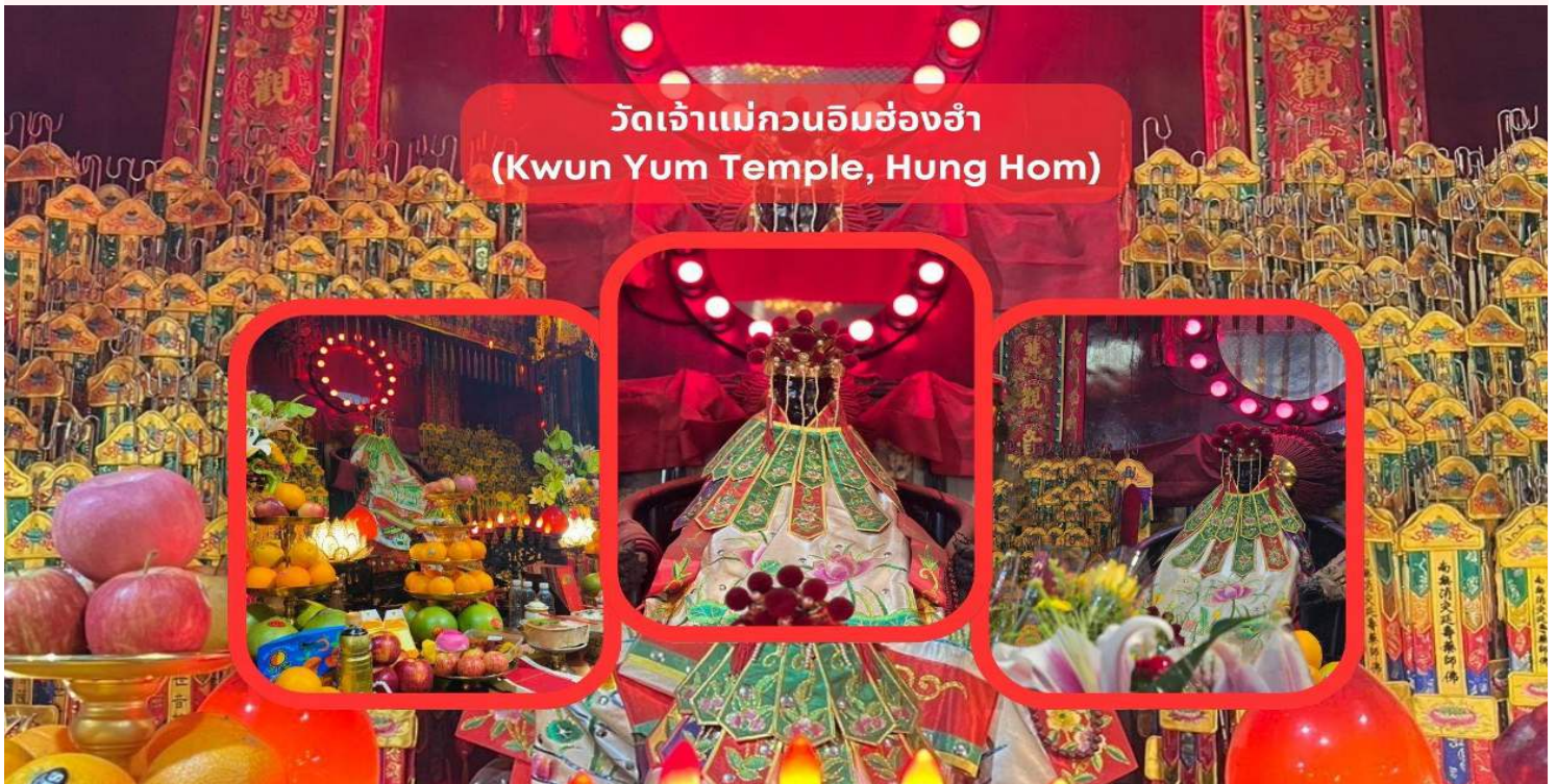
วัดเจ้าแม่กวนอิมฮ่องกง (Kwun Yum Temple, Hung Hom)

นำท่านเดินทางสู่ วัดเจ้าแม่กวนอิมฮ่องกง (Kwun Yum Temple, Hung Hom) เป็นวัดเล็กๆ อันเก่าแก่ ถูกสร้างมาตั้งแต่ปี พ.ศ. 2416 วัดนี้เคยมีปาฏิหาริย์เกิดขึ้น เมื่อช่วงสงครามโลกครั้งที่ 2 มีการปล่อยระเบิดลงบริเวณวัดฮ่องกงหลายต่อหลายครั้ง ซึ่งทำให้ผู้บาดเจ็บล้มตายเป็นจำนวนมากทว่าชาวบ้านที่เข้าไปหลบภัยในวัดฮ่องกงกลับปลอดภัยไม่ได้รับความบาดเจ็บ รวมถึงตัววัดก็ไม่ได้ได้รับความเสียหายแบบน่าเหลือเชื่อ จึงทำให้ชาวบ้านศทาและเลื่อมใสในวัดแห่งนี้มากยิ่งขึ้น และมีลักษณะสถาปัตยกรรมแบบวัดจีนดั้งเดิม วัดแห่งนี้มีชื่อเสียงโด่งดังในเรื่องของ “พิธียืมเงินเทพเจ้า” เพื่อให้เราร่ำรวยเงินทอง เงินไหลกองทองไหลมา โดยปกติทางวัดจะมีการจัดเทศกาลพิธียืมเงินเทพเจ้าโดยเฉพาะ แต่นอกจากนั้นในวันปกติก็สามารถมาทำพิธีขอได้ตามปกติ