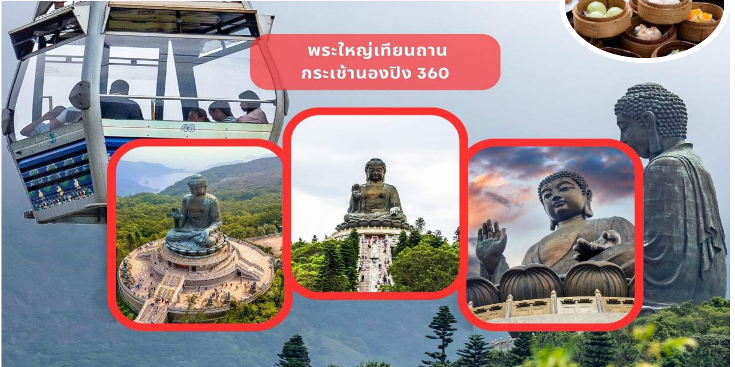
พระใหญ่เทียนถาน กระเช้านองปิง 360

นำท่านเดินทางสู่ เกาะลันเตา สถานีตงซุง นำท่าน ขึ้นกระเช้านองปิง 360 (Ngong Ping 360) ชมวิวมุมกว้าง 360 องศา รวมค่ากระเช้า ตลอดระยะทางทั้งหมด 5.7 กิโลเมตร (ในกรณีทีกระเช้านองปิงปิด ทางบริษัทฯ ขอสงวนสิทธิ์ นำท่านขึ้นชมโดยรถบัสแทน)