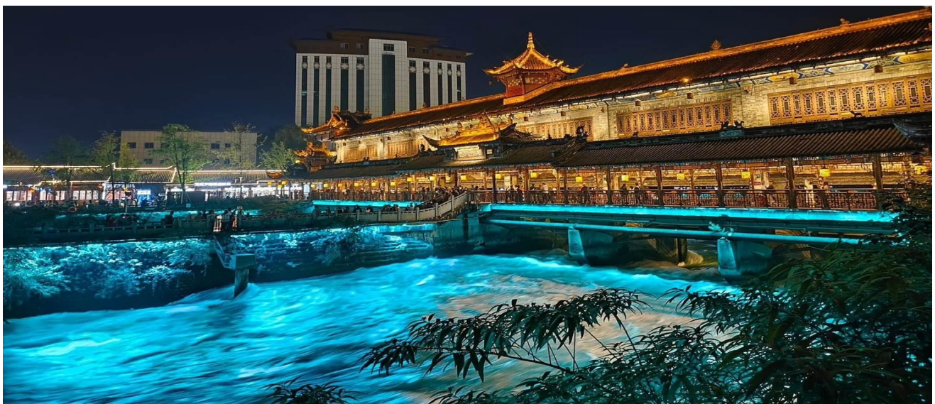
GO1TFU-TG033 เฉิงตู ภูเขาสี่ฤดู สวรรค์แห่งขุนเขา หวงหลง จิวจ้ายโกว 6 วัน 5 คืน (นั่งรถไฟความเร็วสูง) *ไม่ลงร้านช้อปปิ้ง โดยสายการบิน Thai Airways (TG) อัปเดต 08.04.2569

จากนั้นนำท่านเที่ยวชม สะพานโบราณหนานเฉียว (Langqiao Dujiangyan Chengdu China) เป็นสถานที่ท่องเที่ยวยามค่ำคืนขนาดใหญ่ที่มีธีมเป็นน้ำในโครงการอนุรักษ์น้ำตูเจียงเยียน ซึ่งเป็นมรดกทางวัฒนธรรมของโลก โดยผสมผสานเทคโนโลยีสมัยใหม่เข้ากับวัฒนธรรมการอนุรักษ์น้ำโบราณครอบคลุมพื้นที่กว่า 1,000 เอเคอร์ หากได้ไปในเวลากลางคืนท่านจะได้ชมวิวแห่งนี้คือการแสดง แสงและเงา "น้ำตาสีฟ้า" น้ำตาสีน้ำเงินเป็นจุลินทรีย์เรืองแสงที่มีลักษณะเฉพาะ ซึ่งจะเปล่งแสงสีฟ้าเมื่อถูกกระตุ้นส่งผลให้ทะเลสาบปล่อยแสงสีฟ้าลึกลับในเวลากลางคืน นักท่องเที่ยวที่มาเยือนทะเลสาบชิงเฉิงทางเรือจะรู้สึกราวกับอยู่ในแดนสวรรค์ และสัมผัสได้ถึงความอ่อนโยนและความเงียบสงบของผืนน้ำ