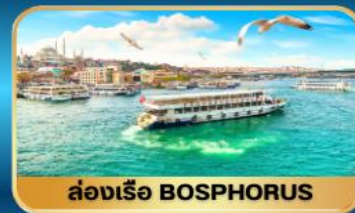
ล่องเรือ BOSPHORUS