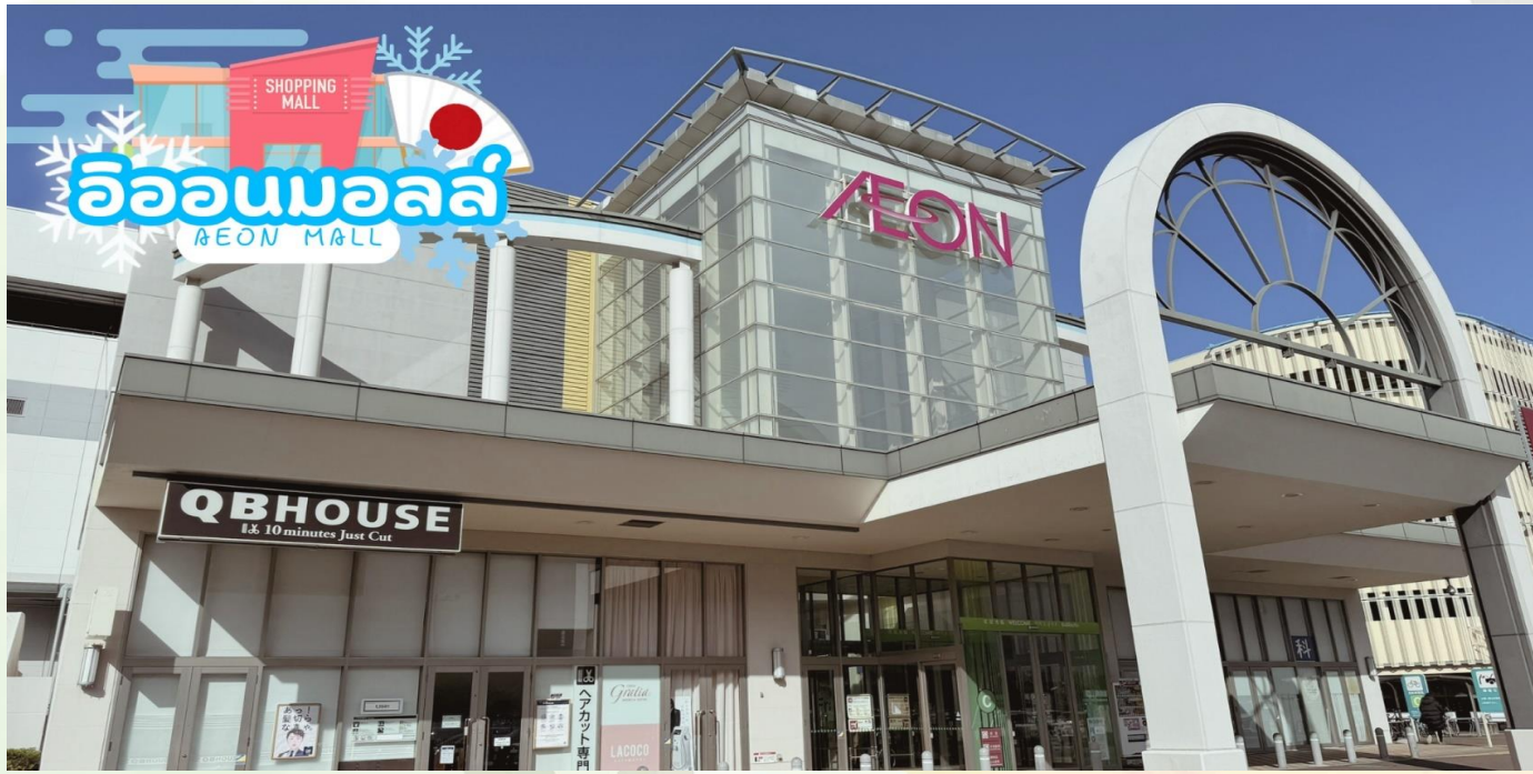
อ็อนมอลล์ AEON MALL

ข้อปิ้ง อ็อน มอลล์ นาริตะ (AEON MALL NARITA) ห้างสรรพสินค้าที่มีสาขาอยู่ทั่วประเทศญี่ปุ่น มีร้านค้าที่หลากหลายมากกว่า 150 ร้าน เช่น MUJI, 100 yen shop, Sanrio store, Capcom games arcade, ร้านขายอุปกรณ์กีฬา และซูเปอร์มาร์เก็ตขนาดใหญ่ ให้ท่านได้เก็บจัดการลิสต์ของฝากมาจากคนที่บ้านได้อย่างครบครันเต็มที่