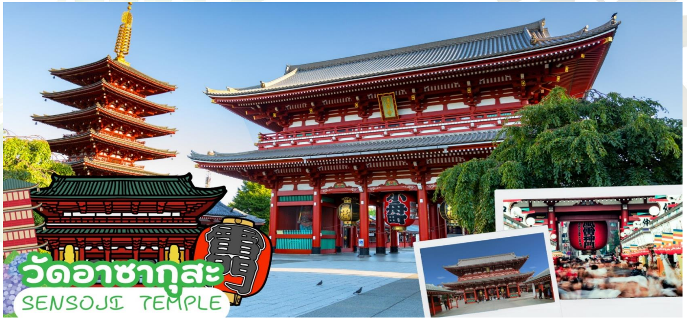
วัดอาซากุสะ SENZOJI TEMPLE

ข้อปิ้ง อ็อน มอลล์ นาริตะ (AEON MALL NARITA) ห้างสรรพสินค้าที่มีสาขาอยู่ทั่วประเทศญี่ปุ่น มีร้านค้าที่หลากหลายมากกว่า 150 ร้าน เช่น MUJI, 100 yen shop, Sanrio store, Capcom games arcade, ร้านขายอุปกรณ์กีฬา และซูเปอร์มาร์เก็ตขนาดใหญ่ ให้ท่านได้เก็บจัดการลิสต์ของฝากมาจากคนที่บ้านได้อย่างครบครันเต็มที่