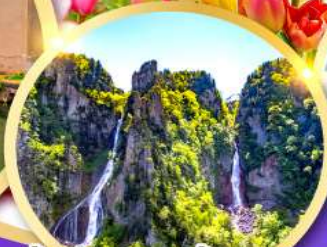
น้ำตกกิ่งกะ-น้ำตกริวเซ