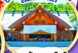
ศาลเจ้าออกโกโด