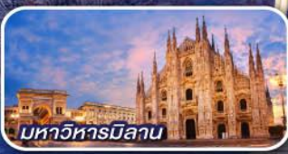
มหาวิหารมิลาน