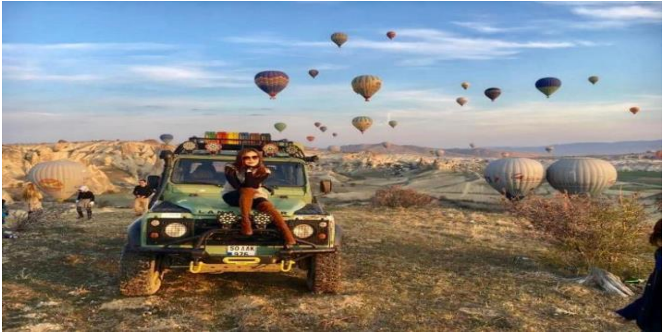
3. Classic Car นั่งรถคลาสสิก เปิดประทุน สูดอากาศ เย็น สดชื่น พร้อมชมบอลูนสีสันสดใส วิวเมืองคัป ปาโดเกีย ค่าใช้จ่าย 120 USD / ท่าน