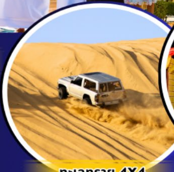
รถแลกราย 4X4