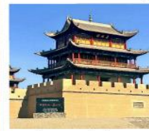
ท่าแพงเจียยี่กวน