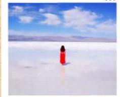
ทะเลสาบเกลือดาซ่า