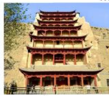
ท่าม่อเกา