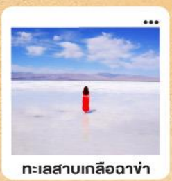
ทะเลสาบเกลือฉาซ่า