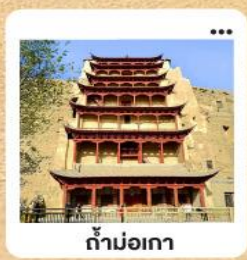
ท่ามอเกา