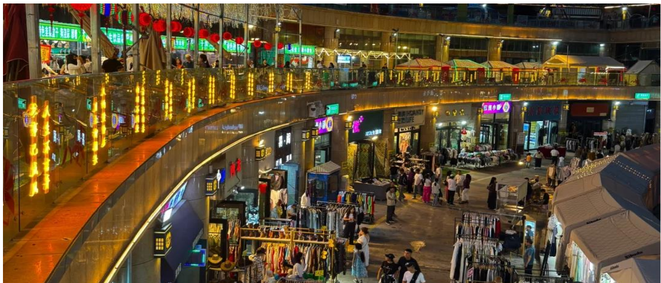
นำท่านเดินทางสู่ ตลาดกลางคืนซีหนิง แหล่งรวมอาหารท้องถิ่นที่หลากหลาย แต่ยังคงสะท้อนถึงการผสมผสานวัฒนธรรมที่เป็นเอกลักษณ์ของชาวซิงไห่ ทิเบต มองโกเลีย และเส้นทางสายไหม เป็นที่รู้จักใน

บินตรงตุนหวง ซีหนิง เส้นทางสายไหม มรดกโลกสองมณฑล กานซู ซิงไห่ พุทธศิลป์มอเกา เขาสายรุ้งจางเย่ เนินทรายจันทร์เสี้ยว กระจกสองฟ้าฮาซา 8 วัน 7 คืน VZ