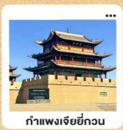
ท่าแพงเจียยี่กวน