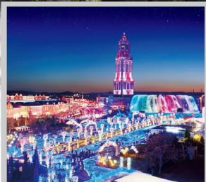
“HUIS TEN BOSCH”