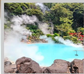
“BEPPU UMI JIGOKU”