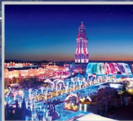
"HUIS TEN BOSCH"