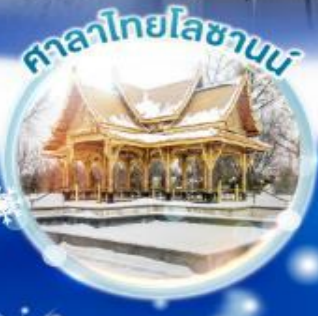
ศาลาไทยโบราณ