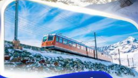
ขึ้นรถไฟฟันเฟืองก่อนขึ้นเครื่องบิน