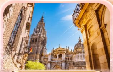
มหาวิหารแห่งโทเลโด