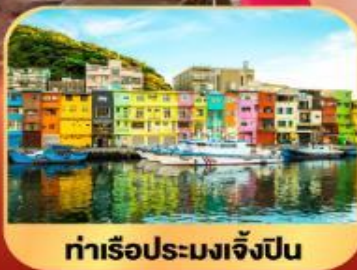
ท่าเรือประมงเจิ้งปิ่น