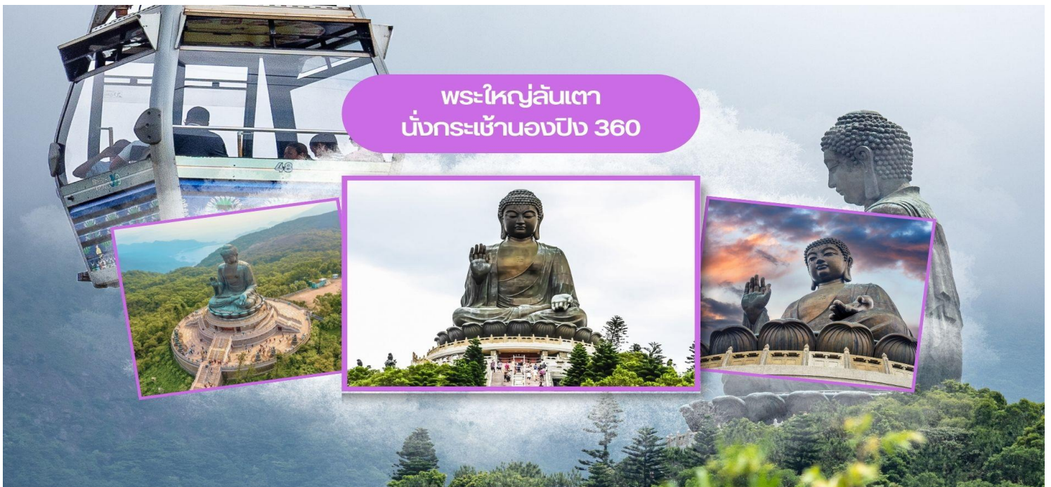
พระใหญ่ลันเตา นั่งกระจกเขานองปิง 360

ฮ่องกง เมืองแห่งสีสันและวัฒนธรรมที่ไม่เคยหลับใหล เป็นเมืองที่เต็มไปด้วยพลังและชีวิตชีวา ตั้งอยู่บนชายฝั่งทางตอนใต้ของจีน ที่นี่เป็นศูนย์กลางทางเศรษฐกิจ การเงิน และการท่องเที่ยวระดับโลก ผสมผสานระหว่างวัฒนธรรมตะวันออกและตะวันตกได้อย่างลงตัว