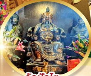
วัดปึกไต่

เสริมโชคกลางน้ำความรุ่งเรือง ทุกด้านของชีวิต