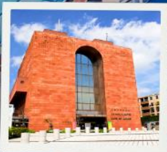
Nagasaki Atomic Bomb Museum