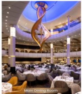
Main Dining Room