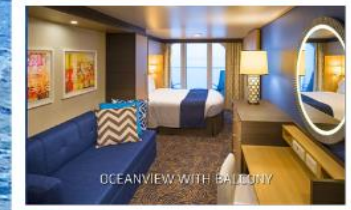
OCEANVIEW WITH BALCONY