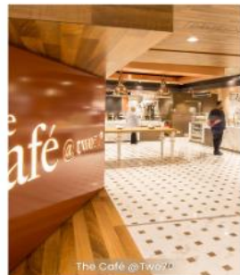
The Café @T270