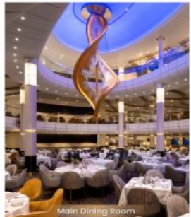
Main Dining Room