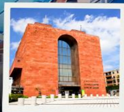
Nagasaki Atomic Bomb Museum