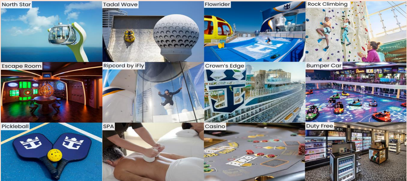
รูปใช้เพื่อการโฆษณาเท่านั้น