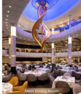
MAIN DINING ROOM