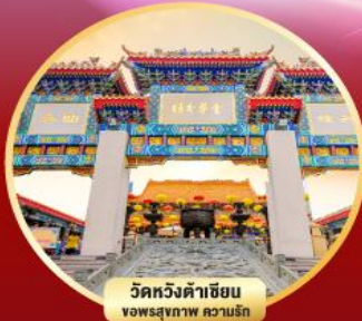
วัดหวังต้าเซียน ขอพรสุขภาพ ความรัก