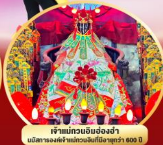
เจ้าแม่กวนอิมย้งฮ่า นับการองค์เจ้าแม่กวนอิมที่มีอายุกว่า 600 ปี