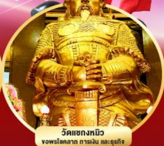
วัดเขกงหนิว ขอพรโชคลาภ การเงิน และธุรกิจ