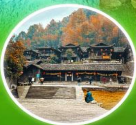
หมู่บ้านผิงเจียจ้าย