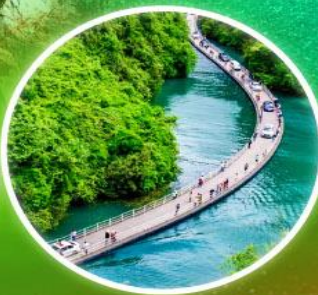
สะพานระเบียงผิง