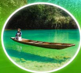
แกรนด์แคนยอนผิงซาน