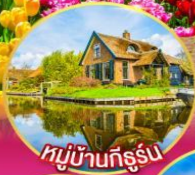
หมู่บ้านที่อรุ่่น