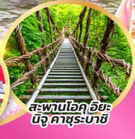
สะพานโอคุโอะ นิจูคาซุระบาชิ