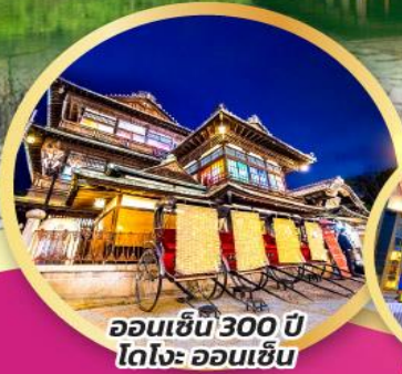
ออนเซ็น 300 ปี โตโจ ออนเซ็น