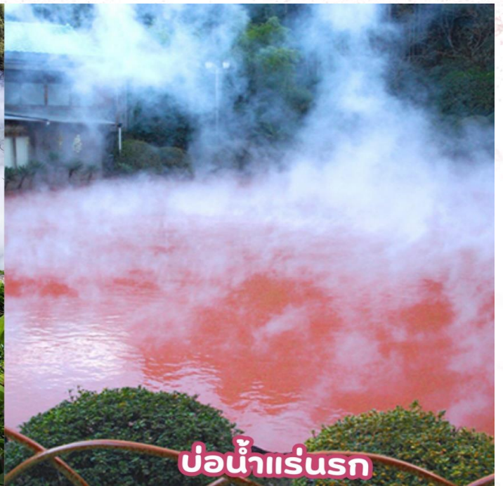
บ่อน้ำแร่รอก

ชม จิโงคุเมงูริ (JIGOKU MEGURI) ซึ่งประกอบไปด้วยบ่อน้ำแร่สีส้มแปลกตาทั้งหมด 8 บ่อ (ใกล้จะพาท่านเยี่ยมชม 2 บ่อ) ที่เกิดจากการรังสรรค์ขึ้นโดยธรรมชาติแต่ละบ่อมีความร้อนสูงเกินกว่า 100 องศาเซลเซียส ด้วยสีส้มและความร้อนชนิดที่มนุษย์ธรรมดาไม่อาจลงไปสัมผัสได้ จึงถูกกล่าวขานว่าเป็นเสมือน “บ่อน้ำแร่รอก” ดังนั้น ที่นี่จึงมีตัวมาสคอตเป็นยมทูตน้อยคอยให้การต้อนรับทุกคนที่มาเยือน