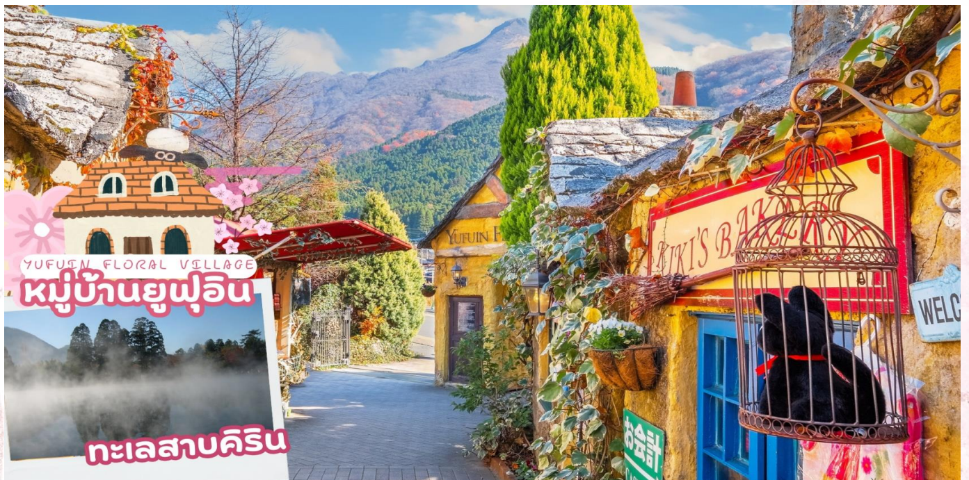
ทะเลสาบคิริน

ชม จิโงคุเมงูริ (JIGOKU MEGURI) ซึ่งประกอบไปด้วยบ่อน้ำแร่สีส้มแปลกตาทั้งหมด 8 บ่อ (ใกล้จะพาท่านเยี่ยมชม 2 บ่อ) ที่เกิดจากการรังสรรค์ขึ้นโดยธรรมชาติแต่ละบ่อมีความร้อนสูงเกินกว่า 100 องศาเซลเซียส ด้วยสีส้มและความร้อนชนิดที่มนุษย์ธรรมดาไม่อาจลงไปสัมผัสได้ จึงถูกกล่าวขานว่าเป็นเสมือน “บ่อน้ำแร่รอก” ดังนั้น ที่นี่จึงมีตัวมาสคอตเป็นยมทูตน้อยคอยให้การต้อนรับทุกคนที่มาเยือน