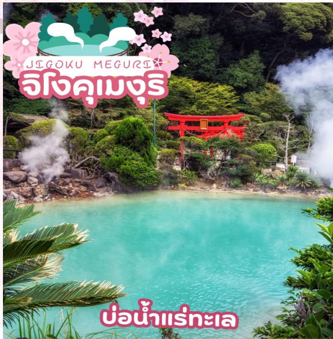
บ่อน้ำแร่ทะเล