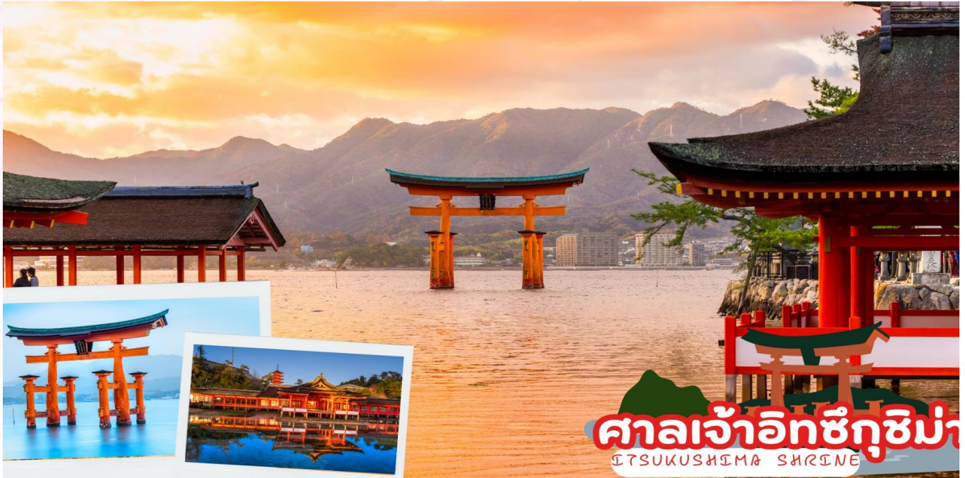
ศาลเจ้าอิทซึคุชิมะ ITSUKUSHIMA SHRINE

นั่งเรือเฟอร์รี่เพื่อข้ามสู่ เกาะมียาจิมา สถานที่ที่ได้รับยกย่องว่ามีทิวทัศน์สวยที่สุด 1 ใน 3 ของญี่ปุ่น และประตูสีแดงกลางน้ำ “โอบุทริอิ” อันเลื่องชื่อ จากนั้นนำท่านสักการะ ศาลเจ้าอิซึคุชิมะ (Itsukushima Shrine) ศาลเจ้าศักดิ์สิทธิ์ที่สร้างคร่อมทั้งบนบกและในทะเล สันนิษฐานว่าสร้างขึ้นในปี พ.ศ. 1136 เพื่อบูชาเทวีแห่งท้องทะเลซึ่งเป็นธิดาสามองค์ของอะมะเทระสุเทวี ในขณะที่น้ำขึ้นเต็มเท่านั้น ศาลเจ้าจะเหมือนเรือขนาดยักษ์ที่ลอยน้ำอยู่ ศาลเจ้าแห่งนี้ได้รับการขึ้นทะเบียนเป็นมรดกโลกในปี พ.ศ. 2539 และรัฐบาลญี่ปุ่นได้ยกฐานะให้เป็นสมบัติประจำชาติ