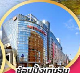
ช้อปปิ้งเทนจิน

สะพานที่สวยงามที่สุดในญี่ปุ่น สะพานคินโตเคียว