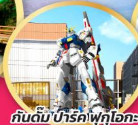
กันดั้มปาร์คฟุกุโอกะ