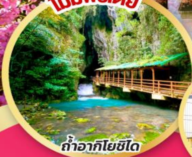
ถ้ำอาทิตโยชิโด