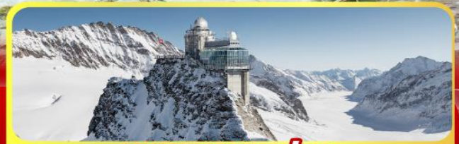
ยอดเทวจุงเฟร่า