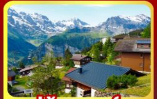
หมู่บ้านเมอร์เรน