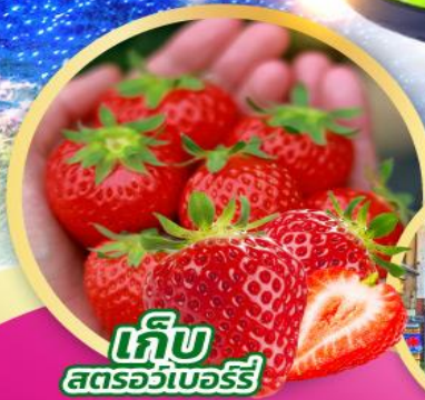
เก็บ สตอร์วเบอร์รี่