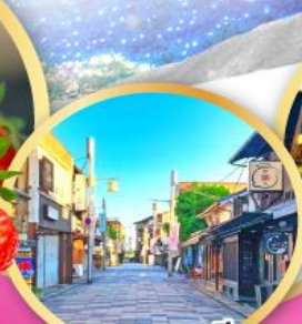
ถนนสายชาเขียว