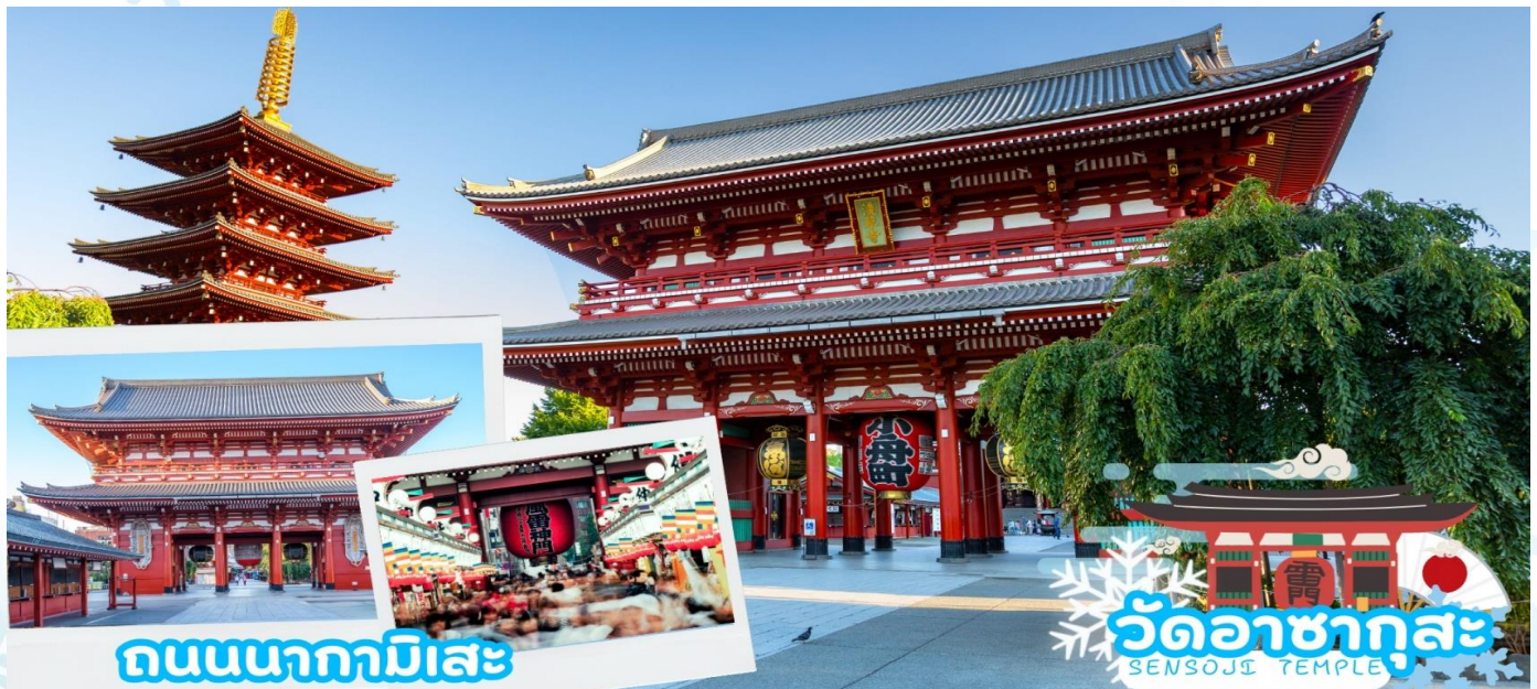
ถนนนากามิเสะ

06.55 น. เดินทางถึง สนามบินฮานเดะ ประเทศญี่ปุ่น (เวลาท้องถิ่นเร็วกว่าเวลาประเทศไทย 2 ชม.) ผ่านขั้นตอนการตรวจคนเข้าเมือง ตำนศุลกากร และรับกระเป๋าเรียบร้อยแล้ว [สำคัญมาก!]ไม่อนุญาตให้นำอาหารสด จำพวก เนื้อสัตว์ พืช ผัก ผลไม้ เข้าประเทศญี่ปุ่นหากฝ่าฝืนมีโทษจับปรับได้