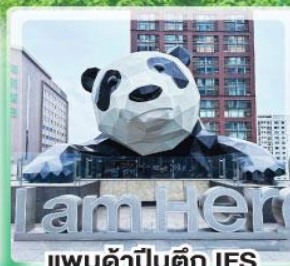
แพนด้าปิ่นตึก IFS