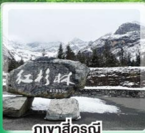
ภูเขาสี่ฤดู