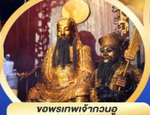
ขอพรเทพเจ้ากวนอู เสริมอำนาจบารมี ความซื่อสัตย์จัดปัดเป่าสิ่งไม่ดี