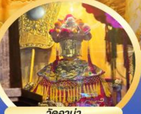
วัดอาม่า ขอพรเรื่องความปลอดภัยในการเดินทาง