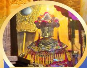
วัดอาเมา

เสริมอำนาจบารมี ความซื่อสัตย์จัดป็นสิ่งไม่ผิด