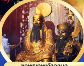
จพรเทพเจ้ากวนอู

เสริมอำนาจบารมี ความซื่อสัตย์จัดป็นสิ่งไม่ผิด