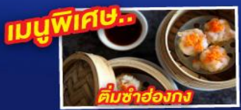
ติ่มซำฮ่องกง