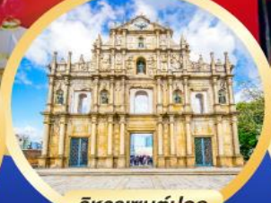
วิหารเซนต์ปอล