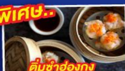
ติ่มซำฮองกง