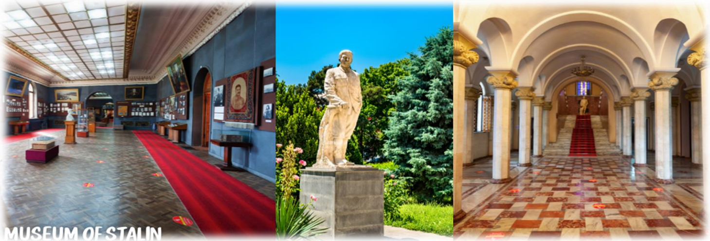
MUSEUM OF STALIN

นำท่านออกเดินทางสู่ เมืองกอรี (GORI) ทุกวันนี้ เป็นเมืองแห่งประวัติศาสตร์ เป็นที่รู้จักกันดีว่าเป็นบ้านเกิดของ “โจเซฟ สตาลิน” (Joseph Stalin) ชาวจอร์เจียที่ในอดีตเป็นผู้ปกครองสหภาพโซเวียต ในยุคศตวรรษที่ 1920 ถึง 1950 และมีชื่อเสียง เรื่องความโหดเหี้ยมในการปกครองในเมืองกอรีแห่งนี้