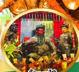
ขอพรเทพเจ้ากวนอู เงินทอง, ธุรกิจมั่นคง