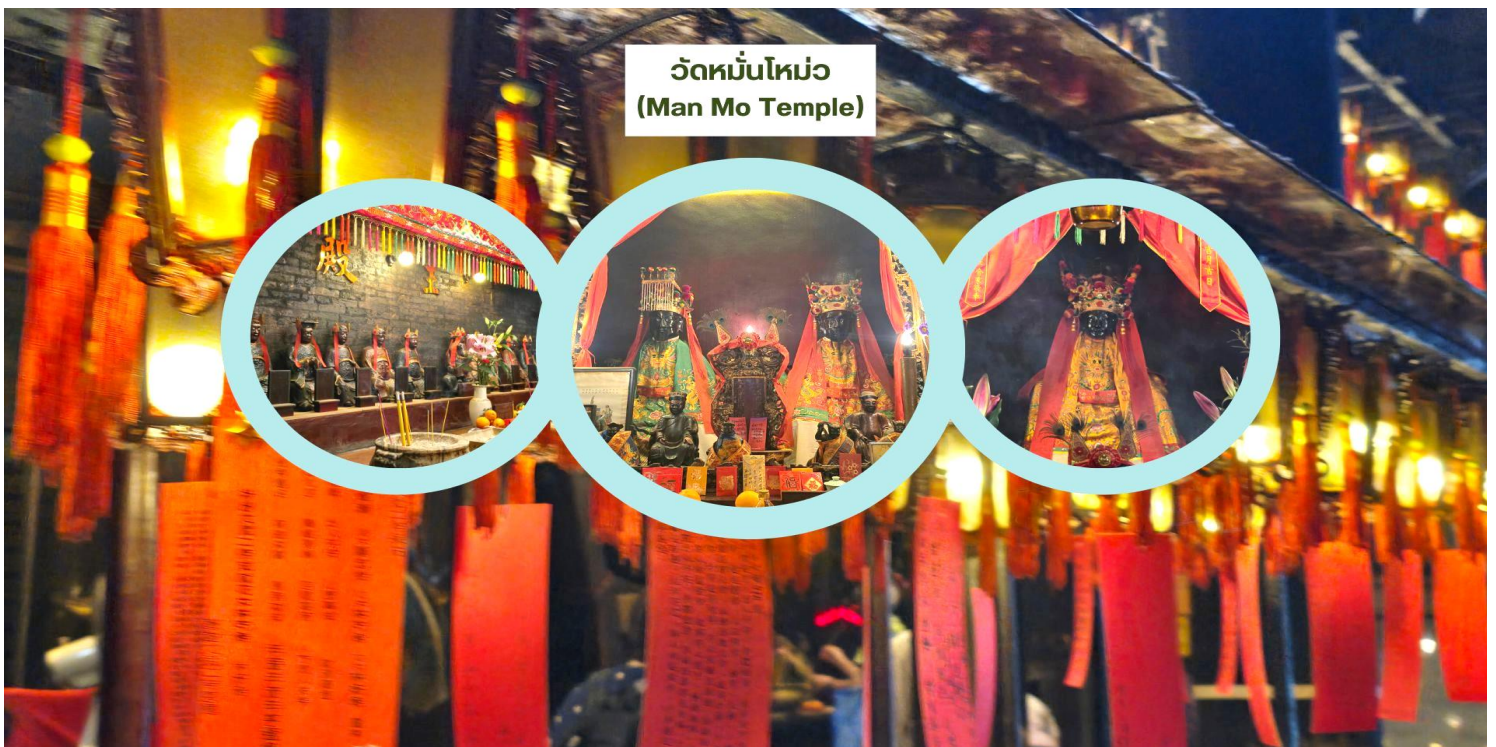
วัดม้านโหม่ว (Man Mo Temple)