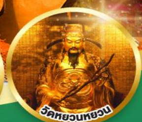
ขอพรเรื่องสุขภาพ, โชคลาภ ความเจริญก้าวหน้า

เมนูพิเศษ! ต้มชาฮ่องกง, บุฟเฟ่ต์ชาบูสโตร์ฮ่องกง, ห่านย่าง