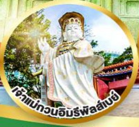
ขอพรรับพลังงานดี เสริมพลังดวงจัญ