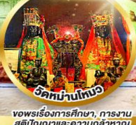
ขอพรเรื่องการศึกษา, การงาน สติปัญญาและความกล้าหาญ