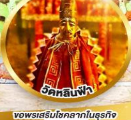
ขอพรเสริมโชคลาภในธุรกิจ และการเงิน