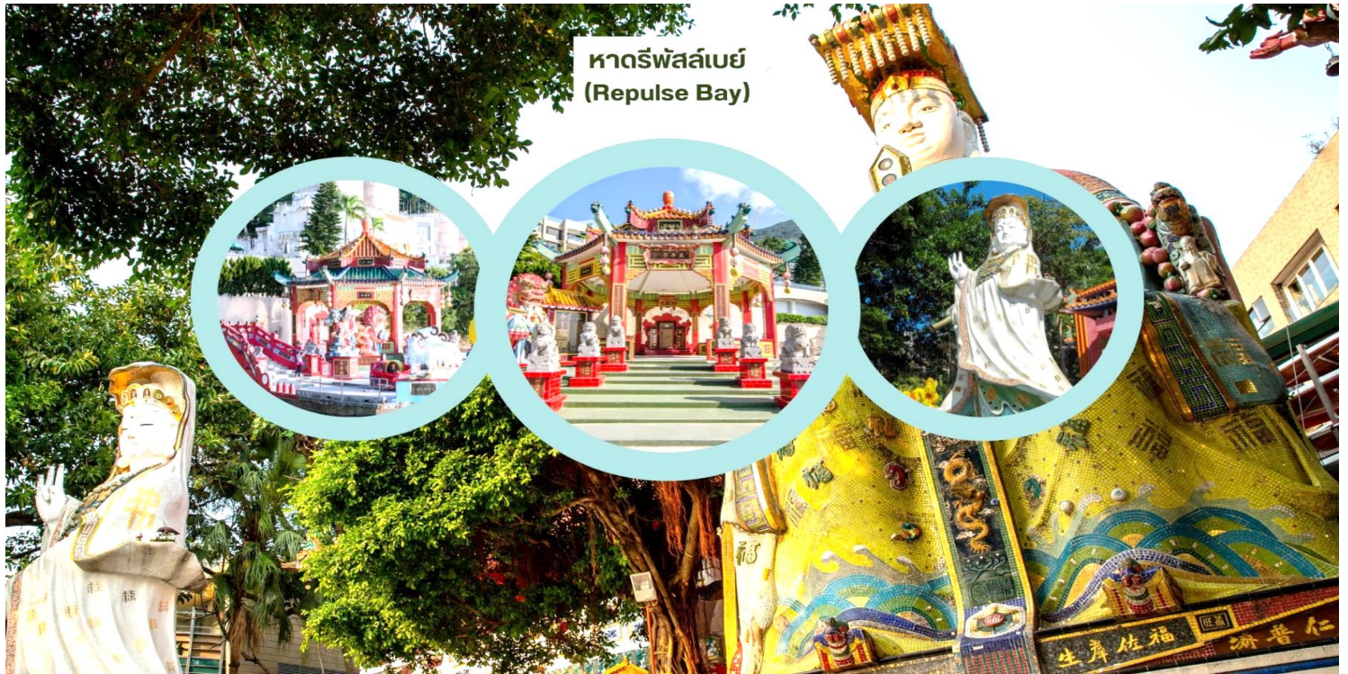
หาดรีพัลส์เบย์ (Repulse Bay)

นำท่านเดินทางสู่ หาดรีพัลส์เบย์ (Repulse Bay) นำท่านขอพรเจ้าแม่กวนอิม หนึ่งในเทพที่ชาวฮ่องกงให้ความเคารพนับถืออย่างมาก ไม่ว่าจะขอพรสิ่งใดก็จะสมความปรารถนาทั้งสิ้น เริ่มต้นด้วยการ เดินเข้าวัดด้วยเท้าซ้าย และออกด้วยเท้าขวา เป็นเคล็ดลับที่ชาวฮ่องกง และคนจีนบอกว่าคล้ายกับการเดินของเข้มนานาฟิกา ซึ่งจะทำให้ชีวิตเจริญก้าวหน้านั่นเอง ก่อนที่จะเดินเข้าวัดให้แวะเสริมดวงแห่งโชคลาภได้ด้วยการ ลูบลูกแก้วในปากสิงโต ด้านหน้าวัด เพื่อให้มีแต่ความโชคดี หากเดินทางเข้ามาภายในวัดแล้วด้านซ้ายมือ จะเป็นที่ประดิษฐานเจ้าแม่กวนอิม และด้านขวามือ จะเป็นที่ประดิษฐานเจ้าแม่ทับทิม หรือเจ้าแม่ทินเห่า เชื่อว่าเป็นเทพแห่งท้องทะเลที่คอยปกป้องรักษาชาวประมงและยังเป็นเทพแห่งโชคลาภ สามารถขอพรกับเจ้าแม่กวนอิมปางประทานพร, ขอพรให้ป้องกันจากภัยอันตราย กับเจ้าแม่ทับทิม, ขอโชคลาภความมั่งคั่งกับเทพเจ้าไฉ่ซิงเอี้ย, ขอลูกกับพระสังกัจจายน์โพธิสัตว์, เดินข้ามสะพานต่ออายุ, ขอพรเรื่องการทำงาน และธุรกิจจากเทริญจินโบราณแห่งโชคลาภ และยัง