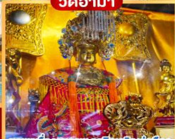
ขอพรเรื่องสุขภาพ/ธุรกิจเจริญรุ่งเรือง