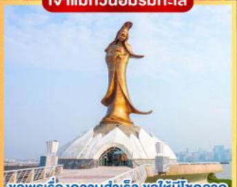
ขอพรเรื่องความสำเร็จ ขอให้โชคกลาง จิตใจเบิกบานสิ่งไม่ตี