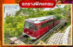
รถรางฟัคเครอ