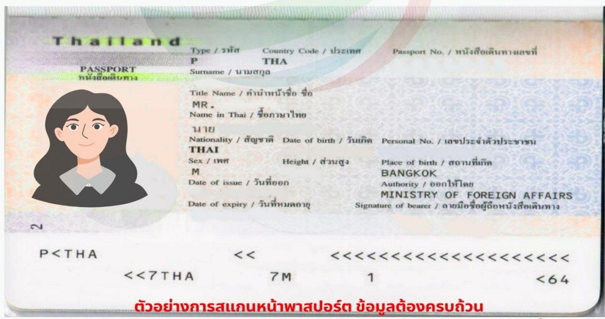
ตัวอย่างการสแกนหน้าพาสปอร์ต ข้อมูลต้องครบถ้วน ท่านสามารถสแกนส่งไฟล์ PDF หรือถ่ายรูปส่งแทนได้ (รูปไม่เอียง ไม่ติดนิ้ว)

การพิจารณาวีซ่าเป็นดุลยพินิจของทางสถานทูตเท่านั้น ทางบริษัทเป็นผู้ดำเนินการเรื่องเอกสารและ อำนวยความสะดวก ซึ่งสามารถกรอกออนไลน์ได้ก่อนเดินทาง 30 วัน หรือหลังจากท่านชำระเงินงวด สุดท้าย ทั้งนี้หลังจากกรอกข้อมูลเข้าระบบแล้วใช้เวลาพิจารณา 7-15 วันทำการ กรณีวีซ่าท่านล่าช้า หรือถูกปฏิเสธและมีค่าใช้จ่ายเพิ่มเติม ทางบริษัทขอสงวนสิทธิ์เก็บตามค่าใช้จ่ายที่เกิดขึ้นจริง