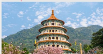
วัดเทียนหยวน