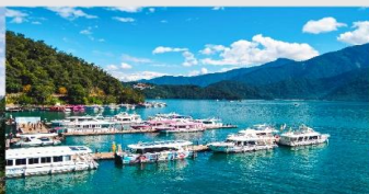
ทะเลสาบสุริยันจันทร