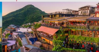
ถนนโบราณจิวเฟิ่น

*ทางบริษัทฯ ขอสงวนสิทธิ์ในการสลับโปรแกรมทัวร์ตามความเหมาะสมขึ้นอยู่กับสถานการณ์หน้างาน โดยคำนึงถึงผลประโยชน์ของลูกค้าเป็นสำคัญ