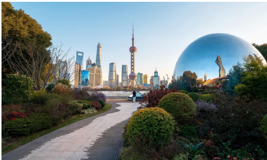
กลางวัน ☺️ รับประทานอาหารกลางวัน ณ ภัตตาคาร

นำท่านแวะถ่ายรูปที่ The North Bund Green Land สวนสาธารณะริมแม่น้ำที่มีมุมถ่ายรูปปกหลังเป็นเซี่ยงไฮ้ทาวเวอร์และหอไข่มุก ที่อยากแนะนำอีกหนึ่งจุด เป็นอีกสถานที่ที่สวยงาม รมรื่น อิสระให้ท่านถ่ายรูปตามอัธยาศัย