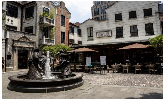
ร้านชา กาแฟ

จากนั้นพาท่านไป Xin tian Di (ซิน เทียน ดี) ย่านอิมเตอร์ใจกลางนครเชียงไฮ้ ที่วัยรุ่นต้องมา กลายเป็นสถานที่ท่องเที่ยวติดอันดับต้นๆไปแล้ว สำหรับแหล่งช้อปปิ้งแห่งนี้ ไม่แพ้แหล่งช้อปปิ้งรุ่นพี่ อย่าง ถนนนานกิง ถนนอูเจียง Yu Yuan Bazaar ถือว่าเป็นอีก 1 ไฮไลท์เด็ดของนครแห่งนี้ เนื่องจากเอกลักษณ์ที่ไม่เหมือนใคร สิ่งปลูกสร้างที่ใช้อิฐบล็อกแบบสถาปัตยกรรมแบบ Shikumen (ซิกเหมิน) การผสมผสานระหว่างสถาปัตยกรรมตะวันตกกับจีนเข้าด้วยกัน ทางเดินหิน กำแพงหิน ประตูหิน บ้านเมืองเก่าแต่ดูแลกรังอย่างดี นอกจากนี้จะเป็นแหล่งช้อปปิ้ง ที่นี้ยังมีคาเฟ่มากมาย ให้นักชิล ไม่ว่าจะร้าน กินดื่ม