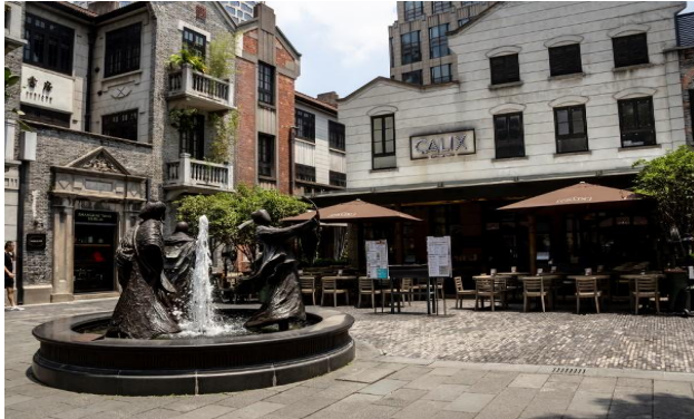
กลางวัน ☀️ รับประทานอาหารกลางวัน ณ ภัตตาคาร

SPHZ-CN12 DOUBLE DELIGHT HANGZHOU SHANGHAI 5D3N_ทัวร์หางโจว_เซี่ยงไฮ้